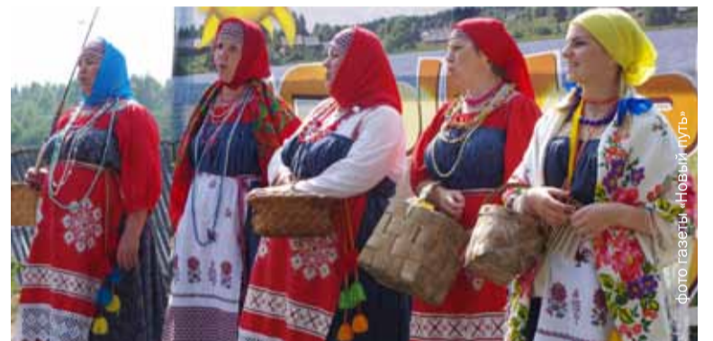
Сразу два традиционных народных праздника прошли в Бокситогорском районе: « Сырный день »...