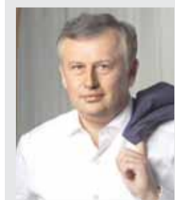
Александр ДРОЗДЕНКО, губернатор Ленинградской области

«Мы с вами в Ленинградской области не можем, не имеем права жить в отрыве от того, что происходит вокруг. И всё чаще мы, к сожалению, замечаем, что нас с вами пытаются лишить прошлого, исказив, изменив и отменив нашу историю. Именно поэтому следующий Ленинградский год я торжественно объявляю Годом истории. Особое внимание в этом году мы уделим нашим историческим корням и культурному наследию. И, конечно, — воспитанию патриотизма. А также тому, чтобы эти слова нашли каждодневный и настоящий отклик в жизни каждого ленинградца».