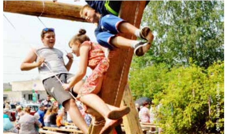
...и « Родники земли Климовской ».