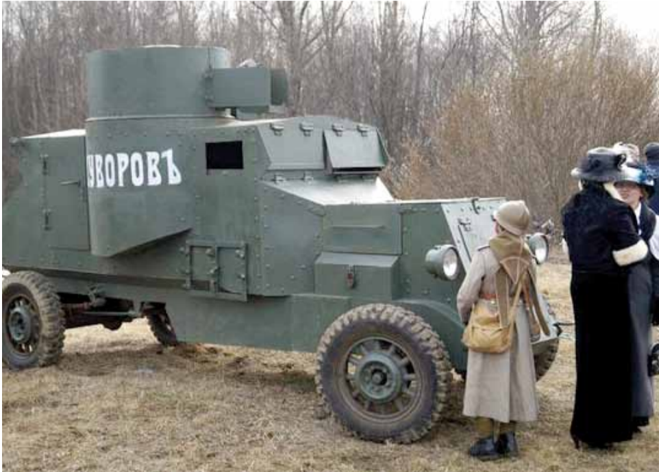
На грандиозный танковый фестиваль «Боевая броня» в Ломоносовском районе съехалась российская боевая техника — от Первой мировой до современных образцов.