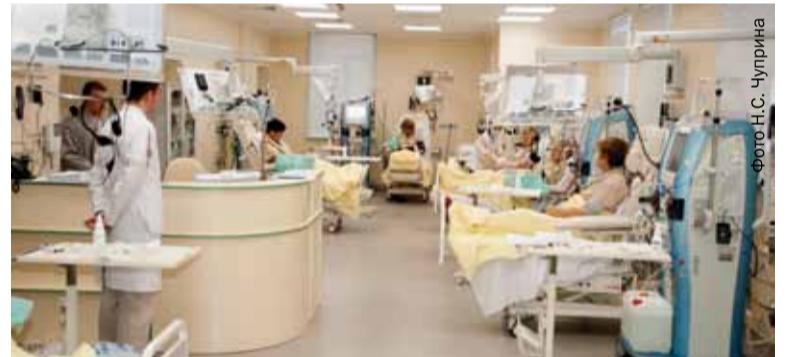
В Луге заработало отделение нефрологии и гемодиализа европейского уровня .