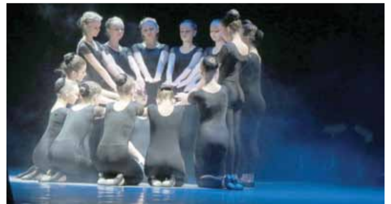
На 25-й юбилейный конкурс «Тихвинский Лель» собрались 1 200 артистов из разных регионов России.