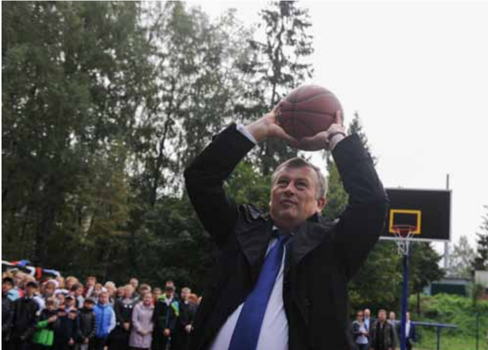
В субботу регион отметил День физкультурника...