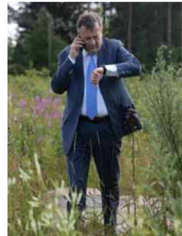
Вы попробуйте. Понедельник — Гатчина, среда — Приозерский район и Волховский, пятница — Кировский район, суббота — Тосненский. Это реальный график одной из последних недель.

— Я не даю пустых обещаний. Я даю людям гарантии того, что все принятые решения будут выполнены.