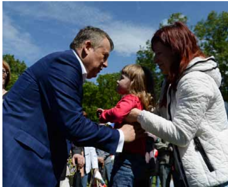
Давайте не будем делить жителей области на больших и маленьких.

темпами газификации. В больших городах, в основном, проблема решена. А вот отдаленные территории по-прежнему ждут «голубого топлива». Вы назвали эту проблему. А что с ней делать?