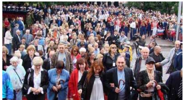
Звезды российского кино съехались в Выборг на XXIII международный кинофестиваль «Окно в Европу».