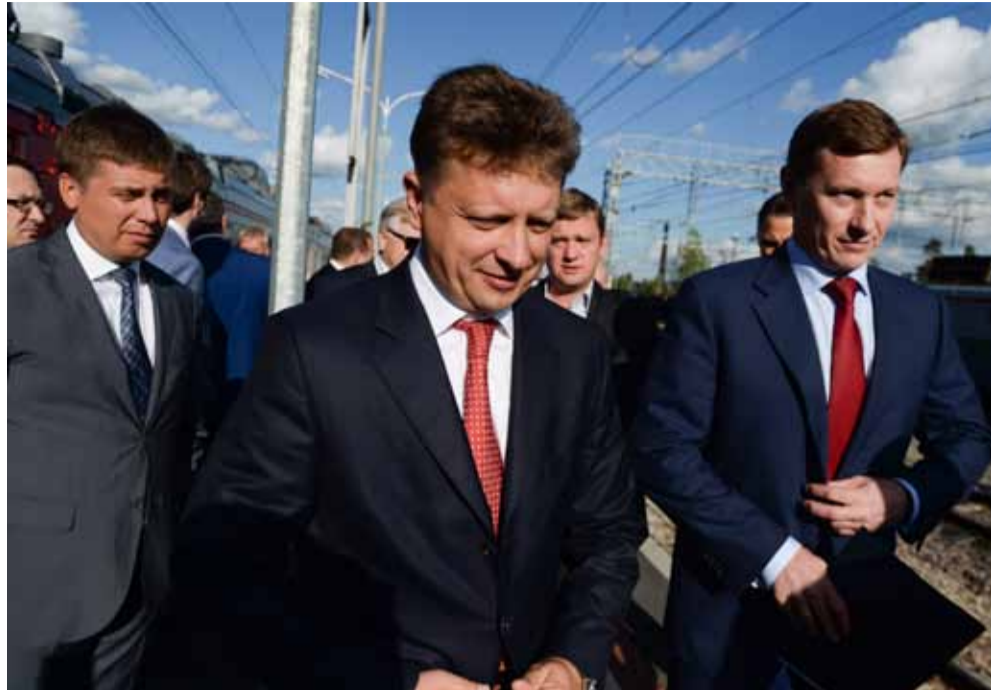
В торжественном открытии рабочего движения по железнодорожному пути между станциями Лосево и Каменногорск принял участие министр транспорта России Максим Соколов.