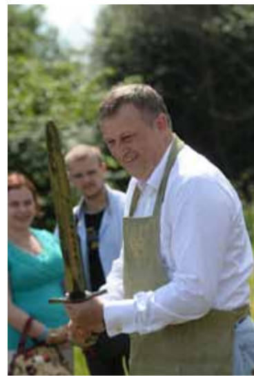
Что нужно делать? Бить по болевым точкам.

— Потому что с этими деньгами муниципальным руководителям надо работать. А некоторые из них этого не умеют или делают вид, что не умеют — заявки нам не отправляют, конкурсы не проводят, дороги не ремонтируют, а лю-