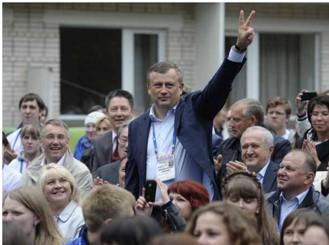
Действующий глава Ленинградской области уверяет, что знает, о чем болит сердце у жителей региона и что с этим делать. В интервью «Общей газете» Александр ДРОЗДЕНКО откровенно рассказывает о том, как он видит положение дел в области сегодня.

куда-нибудь, поговорить с людьми, посмотреть на неподготовленную к визиту губернатора жизнь своими глазами. Я читаю интернет, местную прессу. Провожу телефонные прямые линии — без всяких посредников беру трубку и разговариваю с людьми. Я еженедельно прихожу в эфир программы «Личный контроль» и раз в