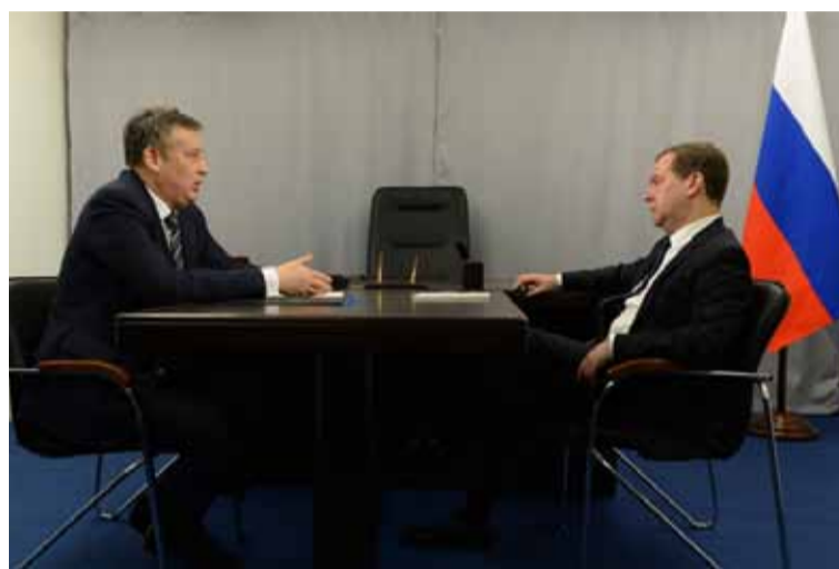
Нам удалось заставить федеральный центр обратить внимание на дороги, которые ему принадлежат, и ремонтировать которые, по закону, никто кроме него не может.

разились, а выполнение решения федерального правительства. Правильного решения. Если это не сделать, то уже через несколько лет процесс станет необратимым. Ремонт многих домов нужен уже вчера и начинать думать об этом завтра — будет поздно. Да, мы приняли, возможно, непопулярное решение — можно было бы потянуть с ним до следующего года, как говорили мне некоторые советчики: выборы же. Но это было бы нечестно. И грош цена тому губернатору, который не в состоянии принимать сложные решения. Я это сделал. Приложив все усилия