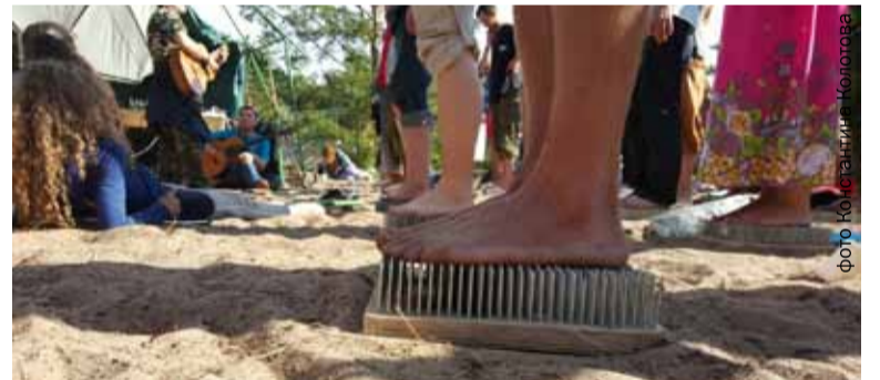
На фестивале «Жизнь без страха» под Выборгом участники поставили рекорд России по стоянию на гвоздях: 68 человек провели на досках с гвоздями 1 час 5 минут.