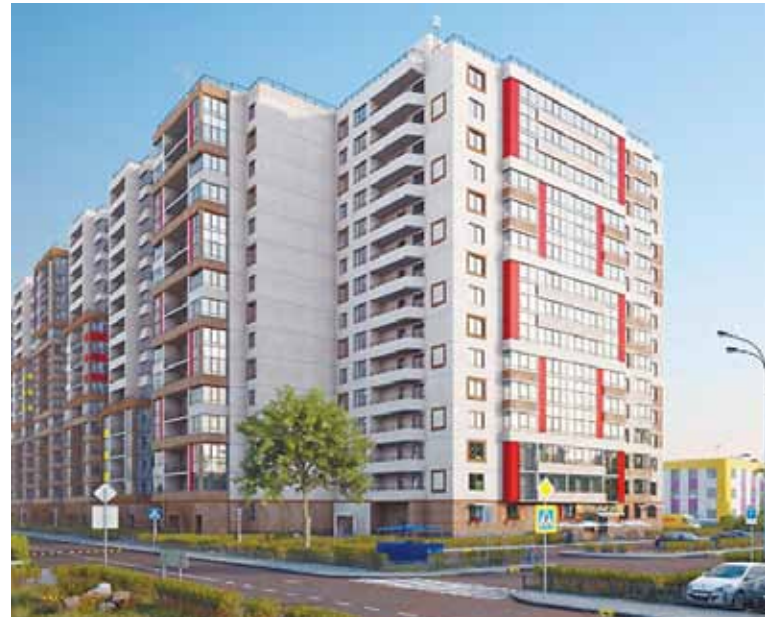
ЦДС «Московский», корпус 2. Срок сдачи IV квартал 2019 г.

✓ 500 м до выезда на КАД ✓ 14 км до Пушкина