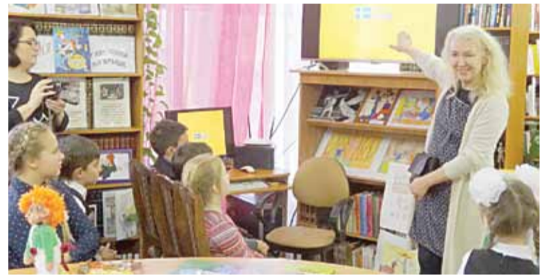
В Гатчинской детской библиотеке отметили день рождения «мамы» Карлсона — шведской писательницы Астрид Линдгрен ...