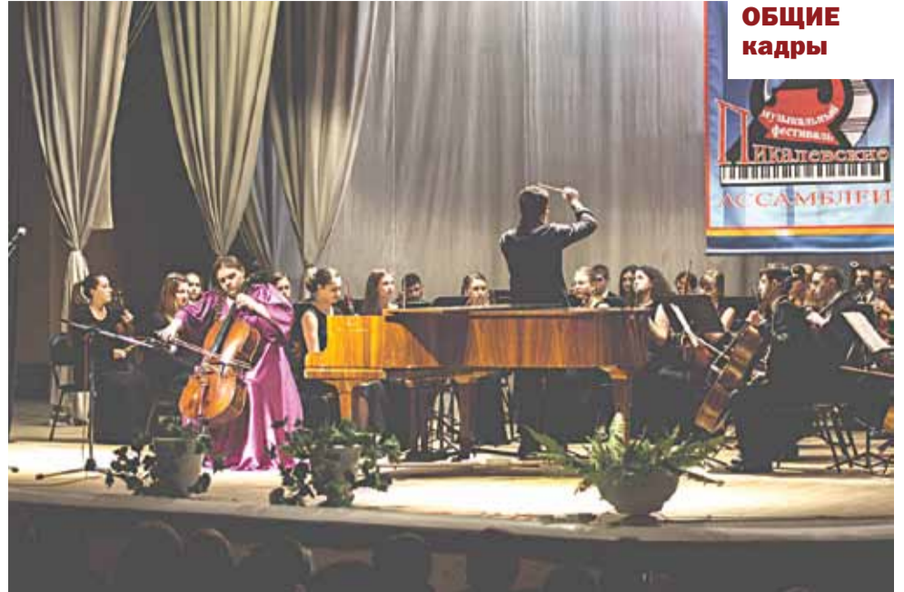
... а любители классической музыки смогли насладиться выступлениями солистов ведущих петербургских театров на «Пикалёвских ассамблеях».