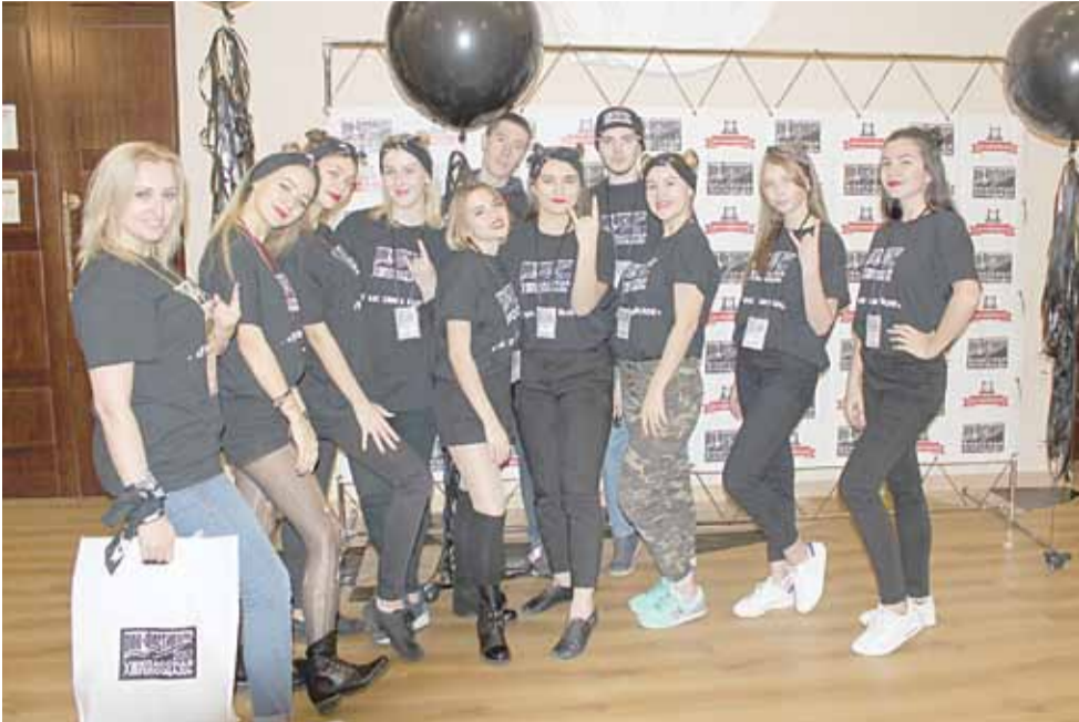
В Кузьмоловском Доме культуры было жарко — там прошёл настоящий рок-фестиваль ...