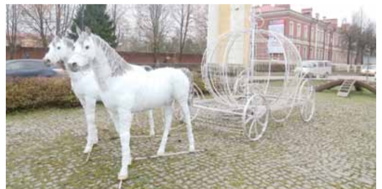
... а в самой Гатчине возле Ингебургских ворот уже стоит запряжённая новогодняя карета.