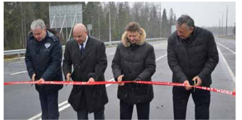
Дорожная сеть области продолжает расширяться ускоренными темпами . Досрочно открыт 12-километровый участок подъезда к порту «Усть-Луга» от федеральной трассы А-180 «Нарва»...

Юных защитников ленинградской земли торжественно посвятили в ряды Всероссийского военно-патриотического движения. ▶