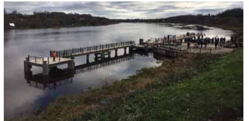
... а в Старой Ладогe открыли долгожданный причал для пассажирских лайнеров.