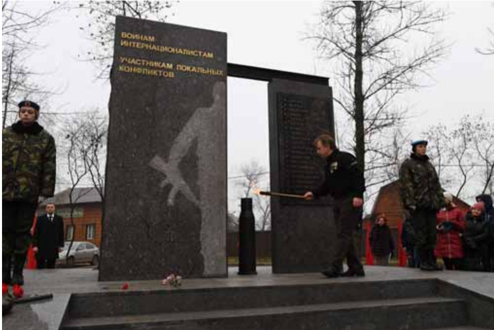
В Тихвине торжественно открыли памятник воинам-интернационалистам и участникам локальных конфликтов. ▲