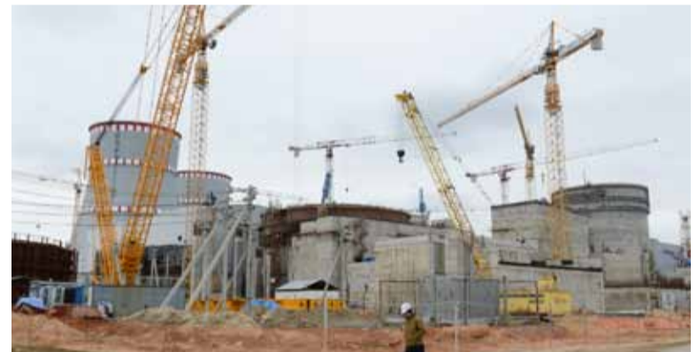
... а на ЛАЭС-2 начались гидроиспытания первого энергоблока станции.