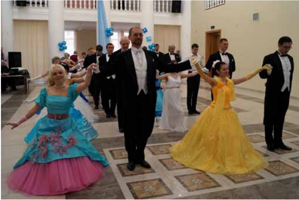
Для участников Весеннего бала , состоявшегося в пикалёвском Дворце культуры, провели мастер-класс по старинному бальному танцу.