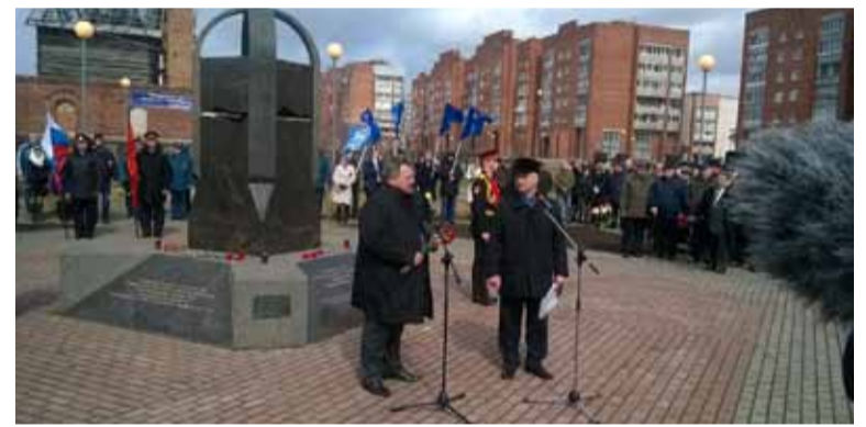
Памятный митинг, посвящённый очередной годовщине аварии на Чернобыльской АЭС, прошёл в Сосновом Бору у памятника ликвидаторам последствий радиационных катастроф...