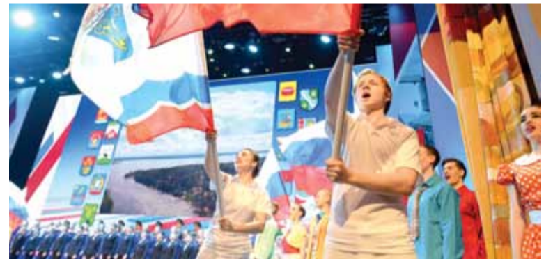
Торжественное открытие Дней Ленинградской области в Москве началось театрализованным Гала-концертом с участием звёзд российской эстрады .