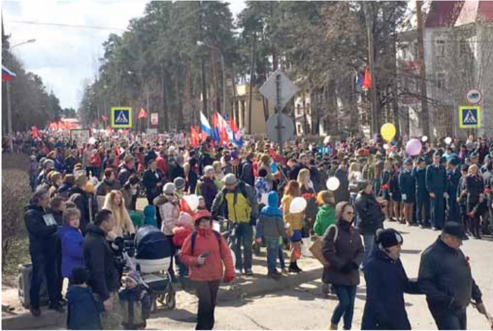
9 мая каждый десятый ленинградец встал в строй «Бессмертного полка». ▲