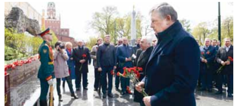
Делегация 47-го региона приняла участие в церемонии возложения венков к Могиле Неизвестного Солдата, мемориалу города-героя Ленинграда и стеле городов Воинской славы.