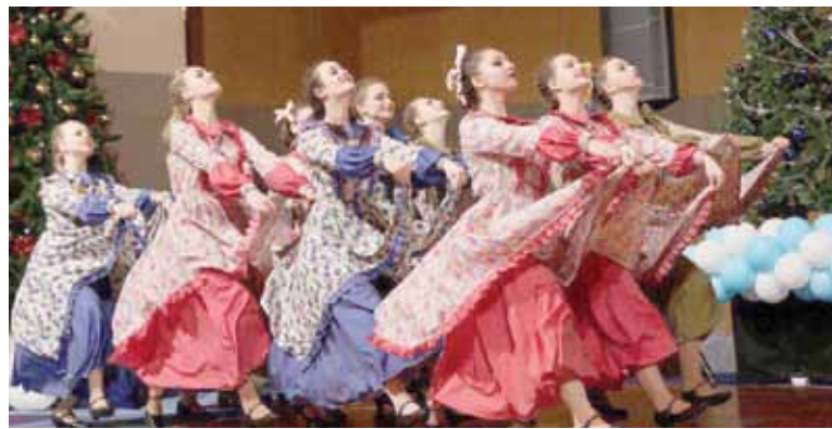
Юные танцоры из тосненского ансамбля «Непоседы» завоевали Гран-при международного фестиваля-конкурса «Зимняя сюита» в Петербурге.