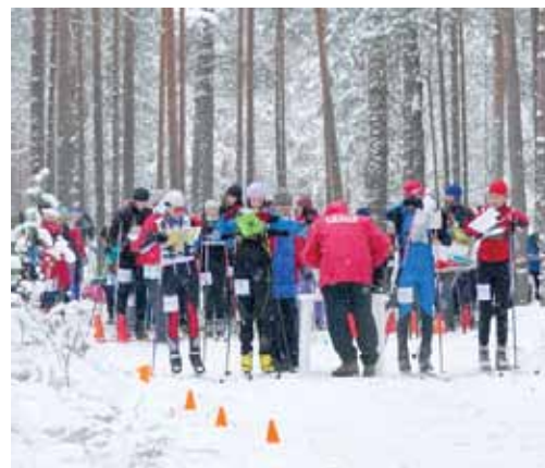
В посёлке Будогощь прошли чемпионат и первенство области по спортивному ориентированию на лыжах. ▶