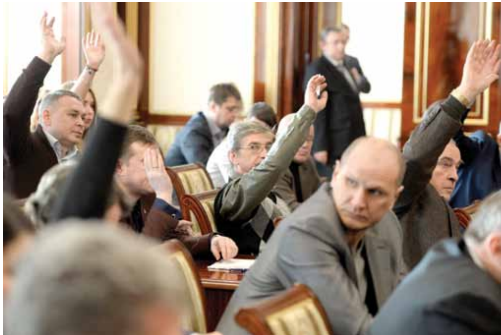
Заседание Экологического совета при губернаторе вызвало живой интерес не только у экологов. ▲