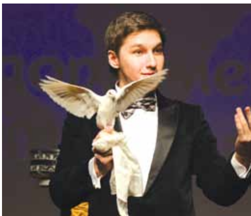
Лучшим ленинградским спортсменам, командам и федерациям вручены награды по итогам 2016 года. ▲